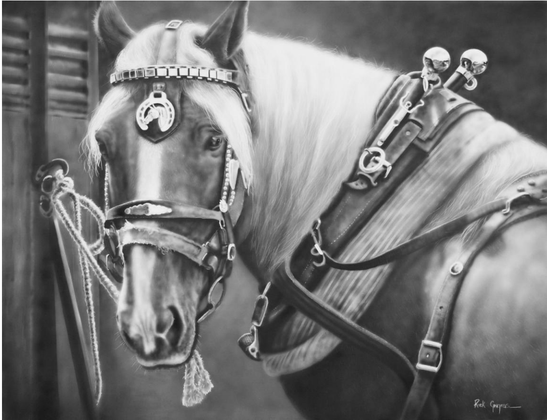
Emmène-moi Acrylique sur canevas 24X30