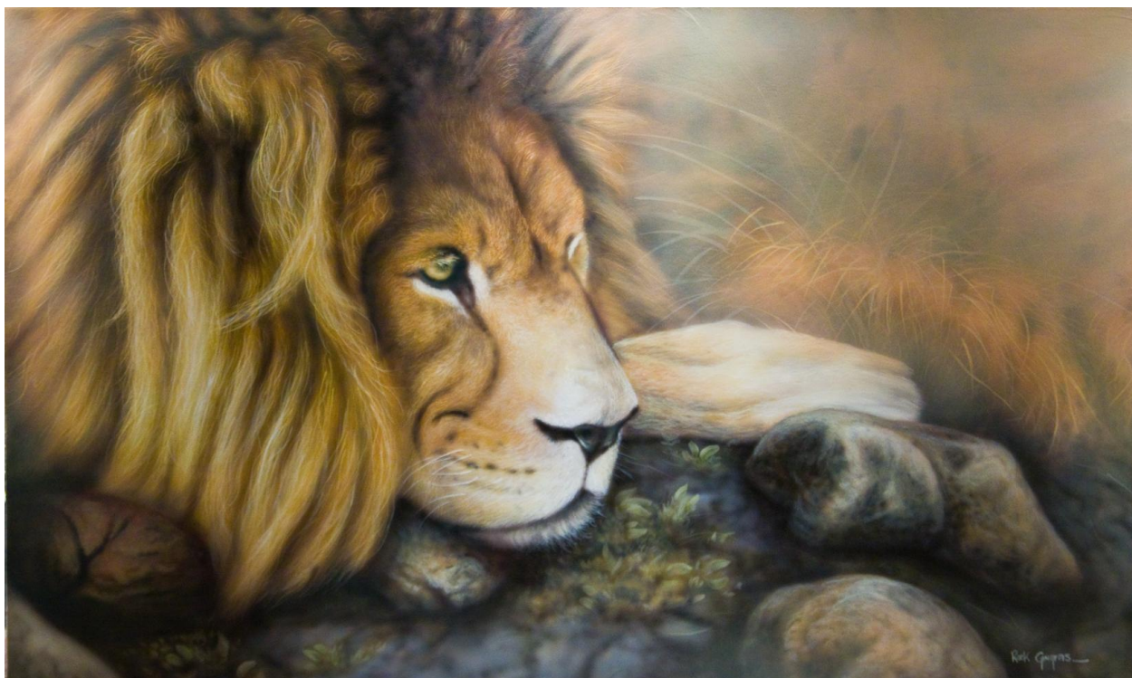
Cœur de lion Acrylique sur canevas 24X40