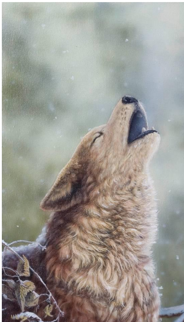
Chant hivernal Acrylique sur canevas 14X24